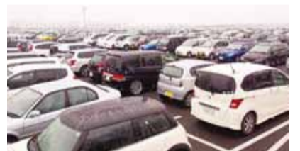
▲NDソフトスタジアム隣に併設された約6000台を収容する無料駐車場

しました。また、今後についても現状維持ではなく天童市として議論を交わし、様々な提案・支援体制を運営母体であるスポーツ振興21世紀協会や県と連携して進めたい意向も伝えました。