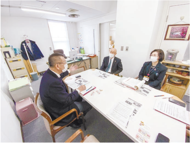
天童市のワクチン接種事業のスケジュールを聞く「天童市健康福祉部」